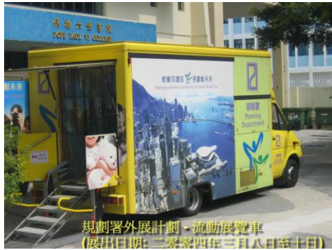
規劃署外展計劃 - 流動展覽車 (展出日期: 二零零四年三月八日至十日)