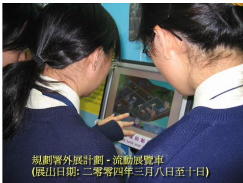
規劃署外展計劃 - 流動展覽車 (展出日期: 二零零四年三月八日至十日)