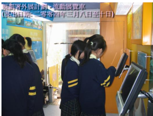
規劃署外展計劃 - 流動展覽車 (展出日期: 二零零四年三月八日至十日)