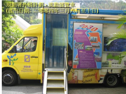
規劃署外展計劃 - 流動展覽車 (展出日期: 二零零四年三月八日至十日)