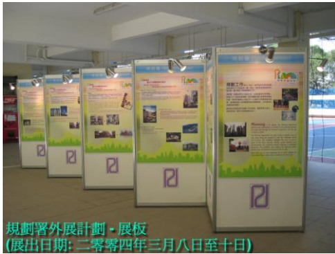
規劃署外展計劃 - 展板 (展出日期: 二零零四年三月八日至十日)